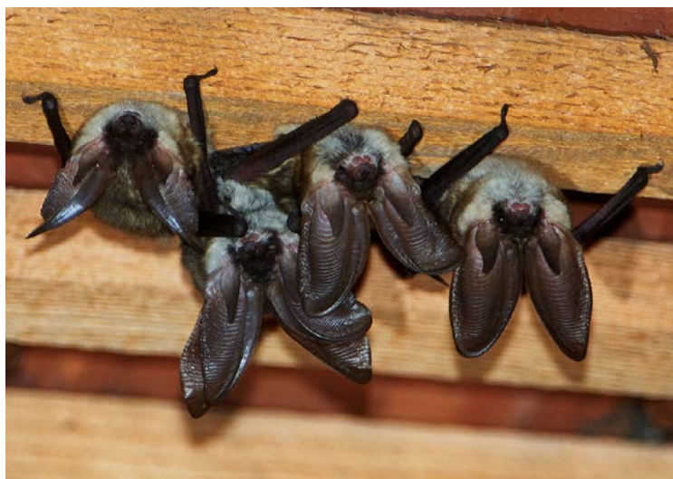
Abb. 1: Besonders Fledermäuse und Vögel sind relevant für den Artenschutz an Gebäuden, werden aber bei Renovierungs- oder anderen Baumaßnahmen oft nur unzureichend berücksichtigt. Frei hängende Gruppe des Grauen Langohrs ( Plecotus austriacus ) in einem Dachstuhl.

Although human demands on form and function are the primary objectives regarding buildings, animal species protection also has its entitlement and specific requirements in settlements. Those must be addressed in planning and implementation procedures, even in the case of single building refurbishments,