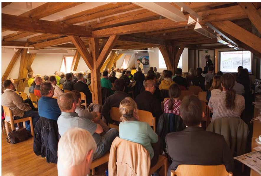
Abb. 8: Es besteht großer Diskussions- und Beratungsbedarf, wie die Teilnahme zahlreicher Interessierter beim 2. Projektworkshop in Tübingen zeigte (Foto: Jennifer Theobald).

Fig. 8: There is a great need for discussion and advice, as the participation of many interested people at the second project workshop in Tübingen showed.