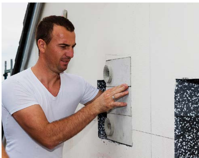
Abb. 9: Auch für Gebäude, die energetisch saniert werden, gibt es Nistkasten-Lösungen, die in die Fassadendämmung eingesetzt werden können (Foto: Johannes Mayer).

nicht im Detail eingegangen wird, weil es hierzu umfangreiche Literatur sowohl im rechtlichen wie auch im fachlichen Zusammenhang gibt (zum Beispiel BLESSING & SCHARMER 2013; RUNGE et al. 2010). Für Bau- und Sanierungsvorhaben an Gebäuden sind dabei insbesondere die Verbote der Verletzung oder Tötung von Tieren sowie der Beschädigung oder Zerstörung ihrer Fortpflanzungs- und Ruhestätten zu beachten. Unter bestimmten Umständen (zum Beispiel wenn größere Fledermaus-Wochenstuben betroffen sind) kann aber auch das Verbot einer erheblichen Störung mit Resultat einer Ver-