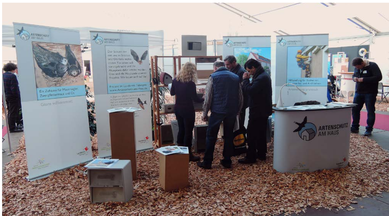
Abb. 10: Beratungsgespräch am Messestand während der Messe „fdf 2015“ in Tübingen.

Die „fdf 2015“ fand vom 28.02. bis zum 08.03.2015 statt; in diesen neun Tagen wurden am Projektstand insgesamt 393 Beratungsgespräche geführt (Abbildung 10). Die von den Standbesuchern am häufigsten gestellten Fragen waren: