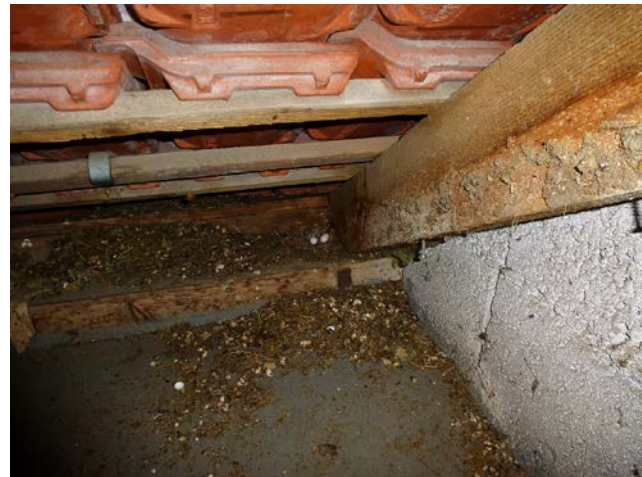
Abb. 4: Mauersegler-Nest ( Apus apus ) mit Eiern im Dachstuhl eines Wohnhauses, der über schadhafte Ziegel für die Art zugänglich war.

Für die im Kontext ihres europarechtlich begründeten Schutzes in Planungsvorhaben speziell zu berücksichtigenden Fledermäuse ist, neben dem tatsächlichen Angebot an Quartieren und Nahrungsflächen im Siedlungsbereich, auch die funktionale Verknüpfung zwischen diesen Bereichen wesentlich und im Rahmen von Planungen zu berücksichtigen (so beispielsweise Flugkorridore entlang von Grünzügen, auch in Verbindung mit dem Umland). Auf anderer räumlicher Maßstabsebene ist die Vernetzung für Wildbienenarten in Städten entscheidend: Die beiden Schlüsselfaktoren eines (a) ausreichenden Blütenangebots als Pollen- und Nektarquellen sowie (b) spezieller Niststrukturen müssen in individuell erreichbarer Nähe zueinander realisiert sein, was eine maximale Entfernung von wenigen hundert Metern bedeutet (siehe zum Beispiel ZURBUCHEN & MÜLLER 2012). Gerade Wildbienen sind dabei eine der Artengruppen, auf die, neben den im rechtlichen Fokus des speziellen Artenschutzes (§ 44 Bundesnaturschutzgesetz, BNatSchG)