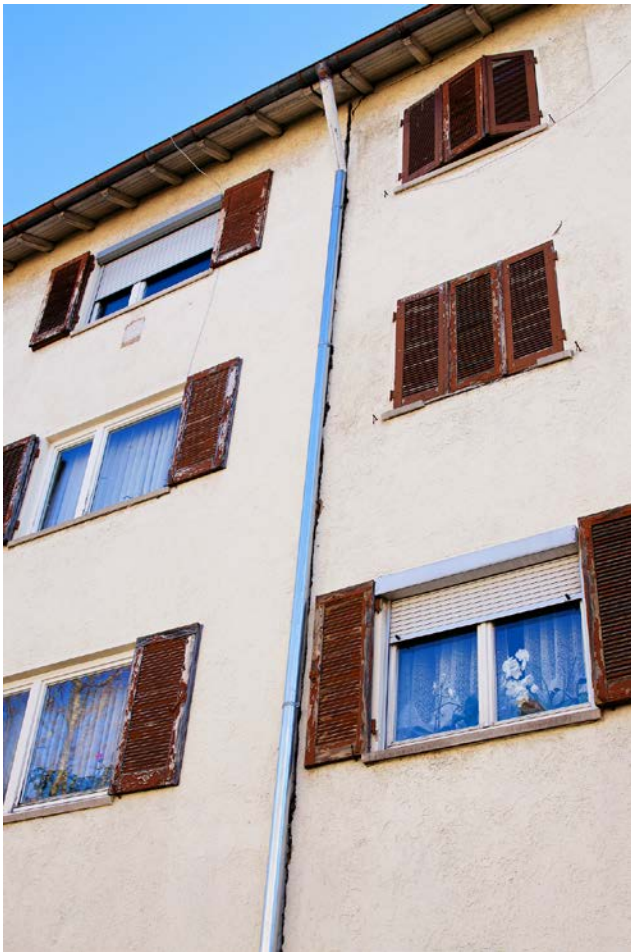
Abb. 3: Teilweise sind es unauffällige Strukturen, die relevant für Arten sind: In dem Spalt hinter dem von der Dachrinne kommenden Fallrohr nistet eine Haussperlings-Kolonie ( Passer domesticus).