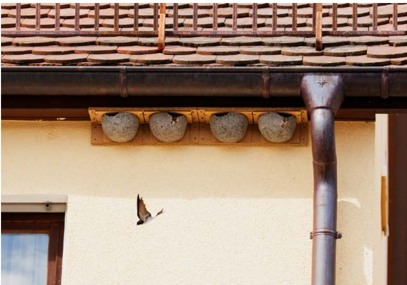
Abb. 2: Eine von zahlreichen Lösungsmöglichkeiten im Gebäude-Artenschutz: Besetzte künstliche Nisthilfen für die Mehlschwalbe ( Delichon urbicum ) unter einem Dachvorsprung.

Es ist eine Selbstverständlichkeit, dass bei Gebäuden die Ansprüche des Menschen an Form und Funktion im Vordergrund stehen. Dies gilt für Neubauten gleichermaßen wie für Sanierung oder Umbau. Auch altersbedingte Schäden an Gebäuden sollen behoben und Gebäude dort, wo es sinnvoll oder erforderlich ist, saniert werden, gerade unter energetischen Gesichtspunkten als Beitrag zum Klimaschutz. Und auch Grünflächen in Städten und Dörfern, egal ob privat oder öffentlich, dienen in aller Regel (soweit keine abweichende Festlegung zum Beispiel infolge eines Bebauungsplanverfahrens erfolgte) anderen vorrangigen Zielen als dem Artenschutz, was akzeptiert werden muss. Aber auch der Artenschutz hat im Siedlungsbereich seine Berechtigung und spezifischen Ansprüche. Diese gilt es bei der Planung und Durch-