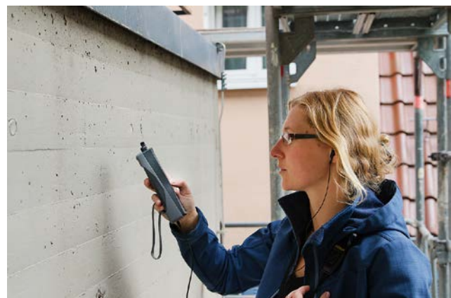
Abb. 5: Hinter dieser metallenen Verkleidung eines Flachdaches hatte eine Kolonie der Zwergfledermaus ( Pipistrellus pipistrellus ) Quartier bezogen.