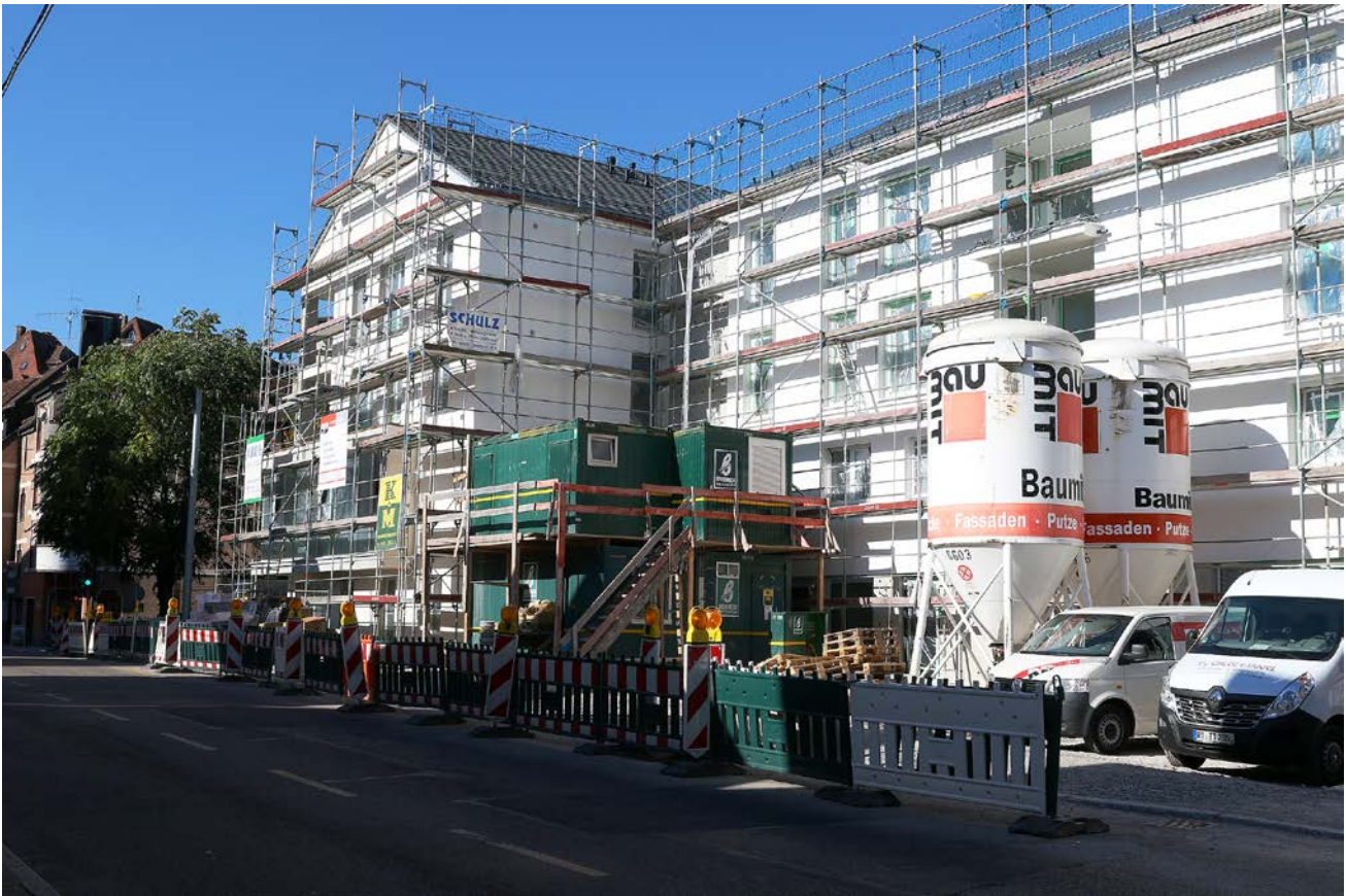
Abb. 7: Neubau- und Sanierungsmaßnahmen beeinflussen Lebensraumstrukturen an Gebäuden im Siedlungsbereich entscheidend. Hier gilt es Konflikte zu erkennen und Potenziale zu nutzen.

Fig. 7: New construction and refurbishment activities crucially affect habitat structures of buildings in settlements. Conflicts have to be recognized and potentials should be used.