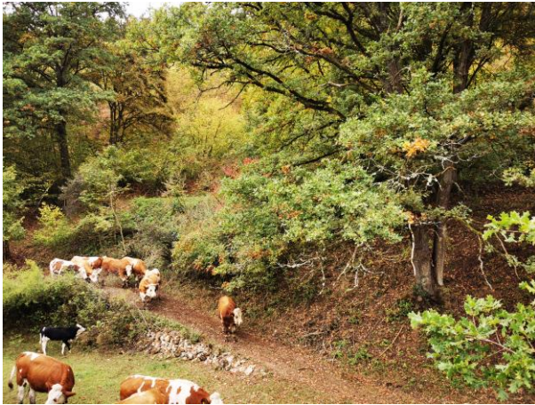
Hutweide/-wald in einem Seitental der Naab